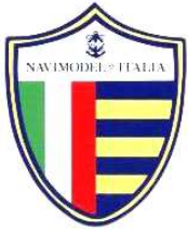
La Federazione Italiana Navimodel,